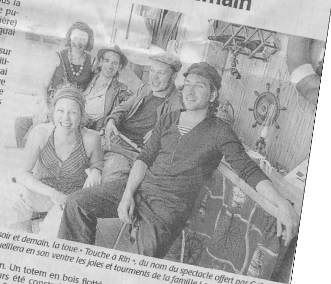
Ce soir et demain, la toue « Touche à Rin », du nom du spectacle offert par Gaïa, accueillera en son ventre les joies et tourments de la famille Laguyille.