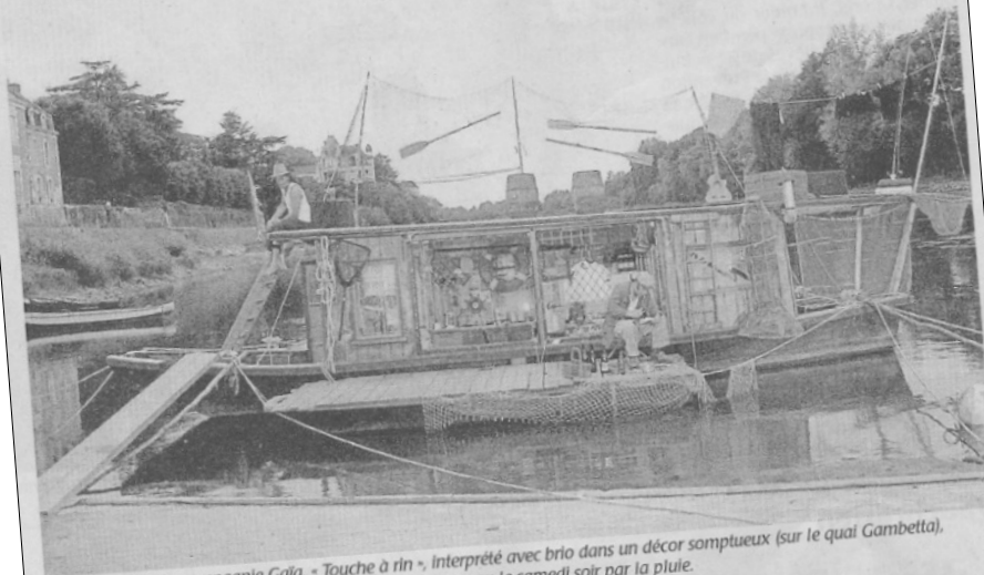
Le spectacle de la compagnie Gaïa, « Touche à rin », interprété avec brio dans un décor somptueux (sur le quai Gambetta), a remporté un franc succès vendredi avant d'être interrompu le samedi soir par la pluie.

Vendredi et samedi, la compagnie Gaïa a proposé sur le quai Gambetta à Chalonnes-sur-Loire sa dernière création « Touche à rin ». La pluie a interrompu le spectacle le samedi, mais la veille le public a savouré l'émouvante histoire de la fratrie Laguyille.